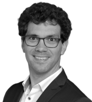
Timo Erfurth Sparprimus GmbH