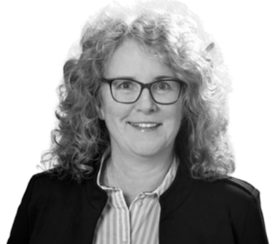
Astrid Reider DKB Bank AG