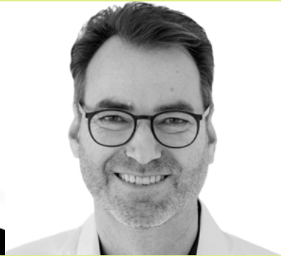
Hajo Oertel Hajo Oertel Beratung & Service UG